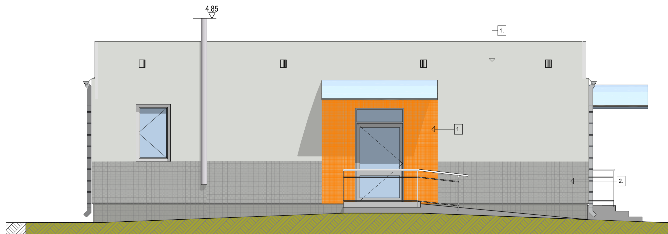
ELEWACJA BOCZNA / północna