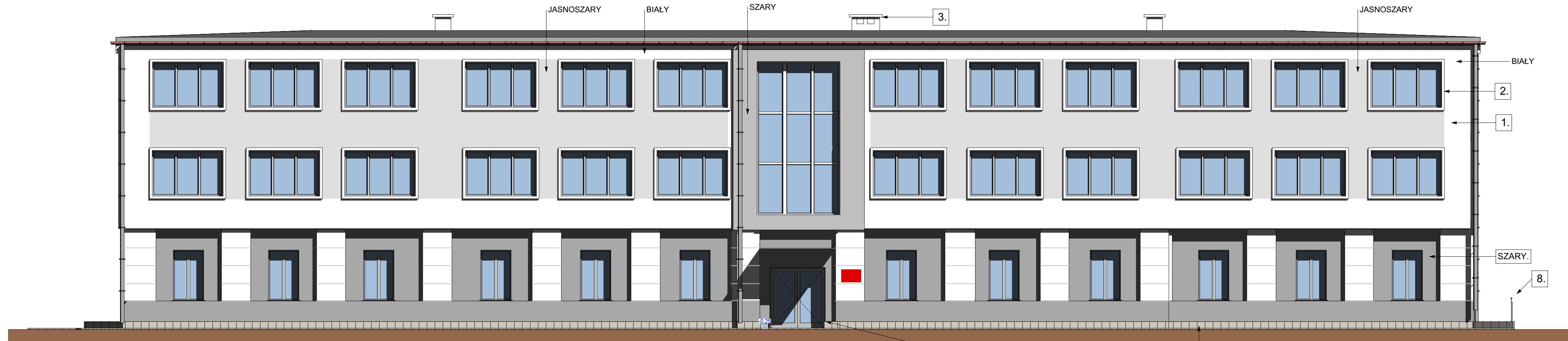
Elewacja Zach. 2.